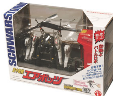
「空中戦機 AIRBOTS(エアボッツ)」 ©WIZ 2007